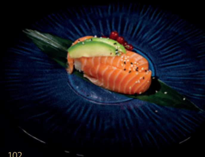
102 Chirashi salmone Riso con sopra fette di salmone crudo Allergeni: pesce