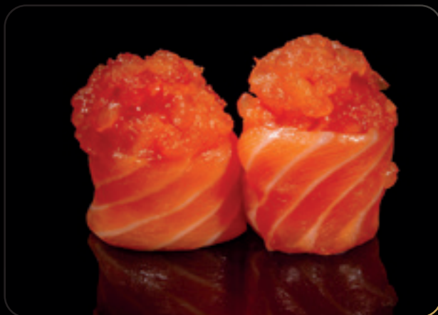
35 Gunkan salmone ● Bigné di riso avvolti da salmone con tartare di salmone spicy Allergeni: pesce, uova