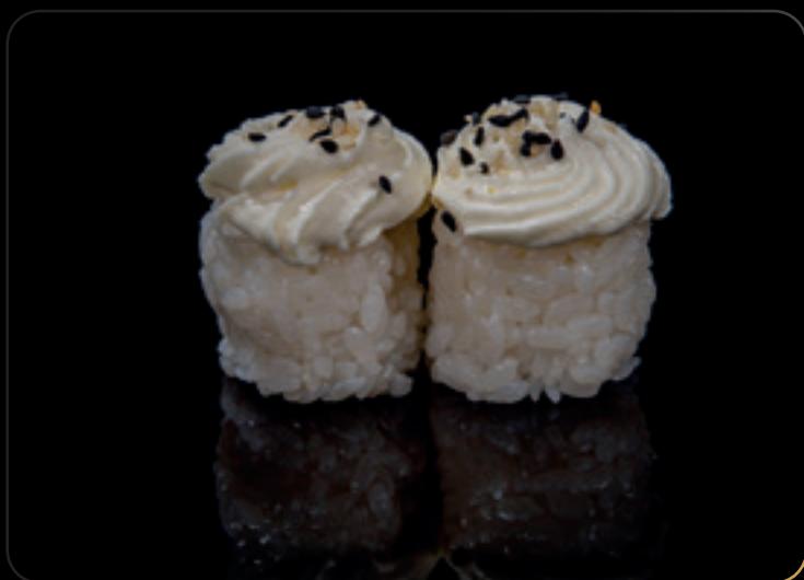
41 Gunkan white Bigné di riso con philadelphia, sesamo e salsa teriyaki Allergeni: soia, lattosio, sesamo