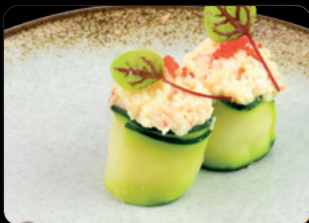
37 Gunkan ebi ● Bigné di riso avvolti da zuccina con tartare di gambero cotto, maionese e tobiko Allergeni: uova, crostacei, pesce