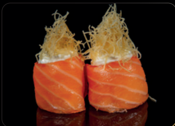
38 Gunkan taste ● Bigné di riso avvolti da salmone con philadelphia, salsa teriyaki e pasta kataifi Allergeni: glutine, pesce, soia, lattosio