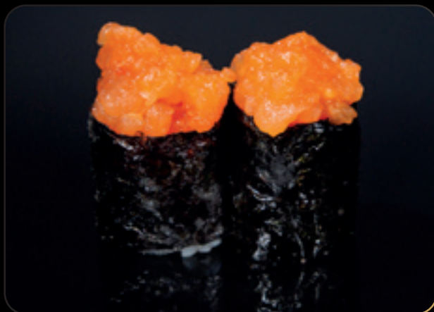
34 Gunkan sake alghe ● Bigné di riso avvolti da alga con salmone, tobiko, maionese, tabasco e sesamo Allergeni: uova, pesce, sesamo