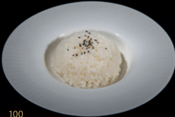
100 Riso bianco Riso bianco