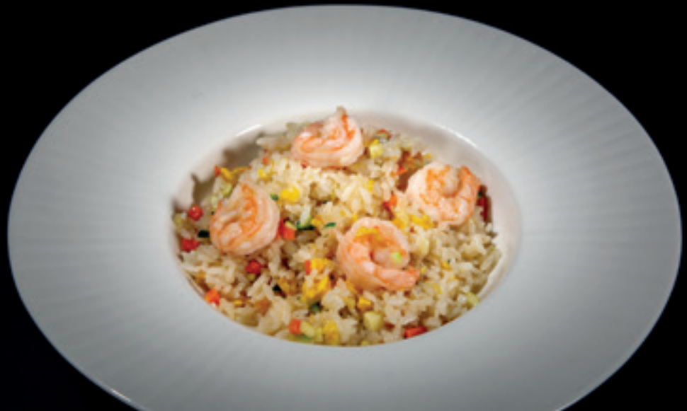
105 Riso saltato con gamberi e verdure Riso, uova, verdure di stagione, gamberi Allergeni: crostacei, uova