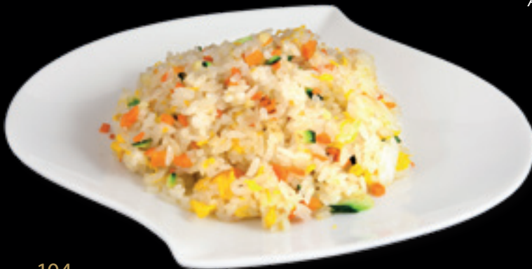
104 Riso saltato con verdure Riso, uova, verdure di stagione Allergeni: uova