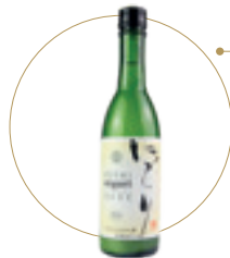
Sake Nigori 3,00 €

Un sake non filtrato che conserva parte del sedimento di riso nella bottiglia che dà un colore bianco latte. Vengono utilizzati i sedimenti più fini e levigati per creare un incredibile gusto cremoso e ricco. La consistenza è vellutata, liscia e morbida, e ha un sapore tropicale simile al latte di cocco. Consigliato berlo freddo.