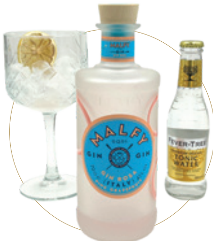
Gin Malfy rosa 8 € GIN MALFY ROSA + INDIAN + ARANCIA Sa di pompelmo rosa