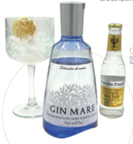
Gin Mare 9 € GIN MARE + INDIAN + LIME Sa di rosmarino, timo e limone