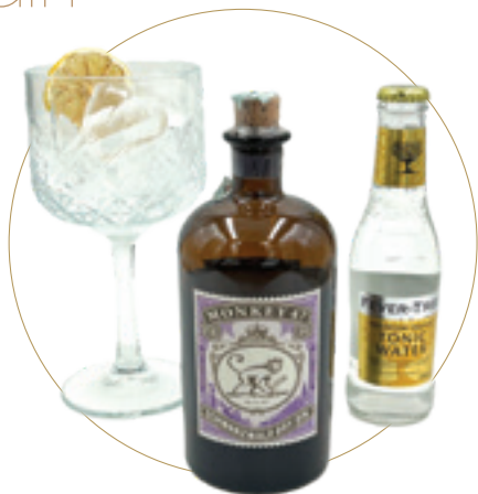
Gin Monkey 47 10 € GIN MONKEY + INDIAN + LIME Sa di limone, lime, ginepro e fiori di sambuco