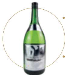
Sake caldo piccolo